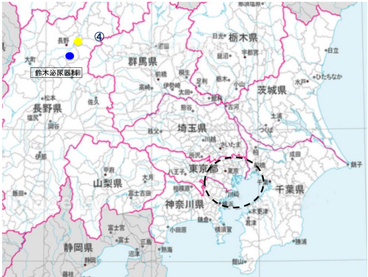
下地図は東京近郊の拡大地図